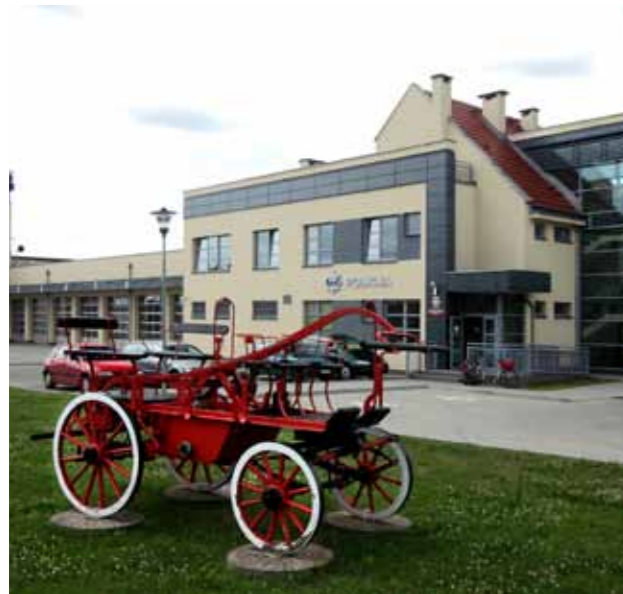
Feuerwehr- und Katastrophenschutzzentrum in Witnica / Regionalne Centrum Ratownictwa w Witnicy