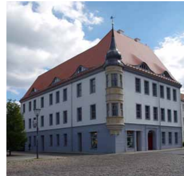
Bolfrashaus Frankfurt (Oder) / Dom Bolfrasa